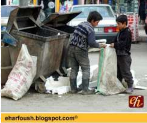
الفقره يعكسون الرزق من قمامة الأثرياء!!!

• عاش العرب قبل الإسلام مرحلة من التخلف والجهل في بعض الجوانب الدينية والاجتماعية بينما اتصفوا بصفات وخصال حميدة وتميزوا في الجوانب الفكرية والثقافية والاقتصادية وبعد ذلك انبثق فجر الإسلام حيث حدثت تغيرات وتطورات شملت جميع نواحي الحياة الدينية والسياسية والثقافية والاقتصادية